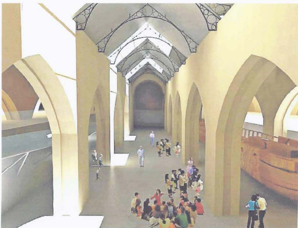
Recreación virtual de dos naves de las Atarazanas con la altura original, la que tuvo en el siglo XIII